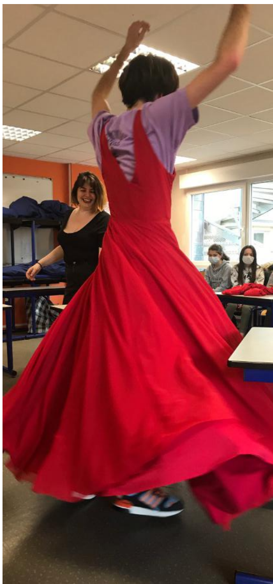
Répétition publique au collège Tancred de Hauteville de Saint Sauveur Lendelin