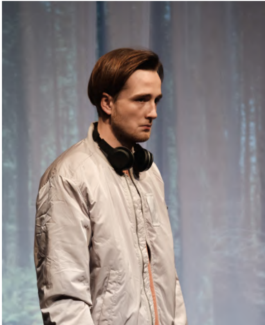
Noa (Baptiste Dupuy) dans la version en salle