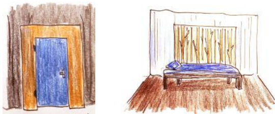
Croquis préparatoires de Cerise Guyon