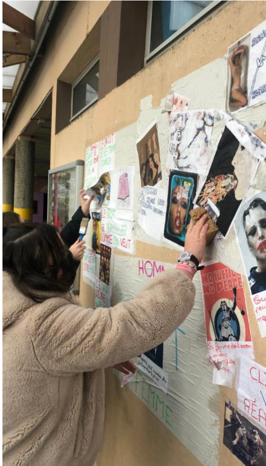
Séance de collage avec les collégien.nes du collège La Vanlée à Bréhal